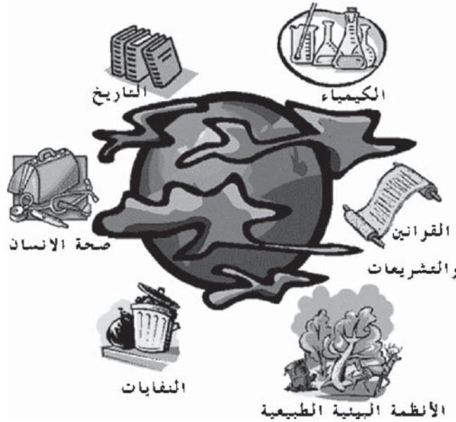
الشكل ( 2-1 ) علاقة علم البيئة بالموضوعات الأخرى

علم البيئة: يعني الدراسة المنظمة للبيئة المحيطة بنا وموقعنا المناسب فيها. ويعتبر من الموضوعات الجديدة نسبياً، والذي يعمل على تكامل العلوم الطبيعية والاجتماعية والإنسانية لدراسة العالم المحيط بنا بشكل واسع وشمولي. ويحاول الوصول إلى تعميمات حول العالم الطبيعي الذي نعيش فيه وتأثير الإنسان في هذا العالم، ومحاولة البحث عن حلول للمشكلات البيئية التي أوجدها الإنسان.